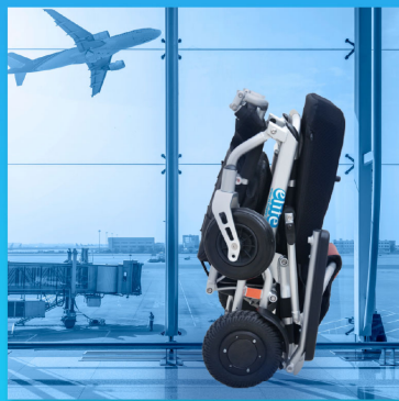
โหลด/on board เครื่องบินได้