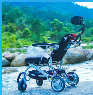
ปรับเอนได้