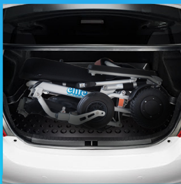
พับใส่ท้ายรถ