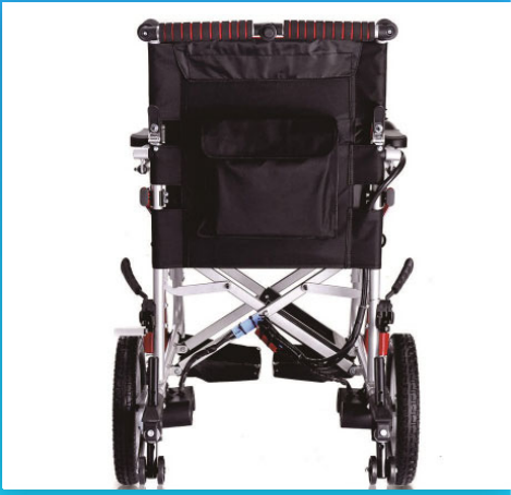
น้ำหนักรถเข็นเบาเพียง 13.5 kg