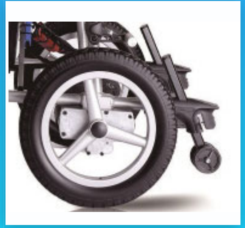
ล้อยางตัน+ล้อกันหกลาย