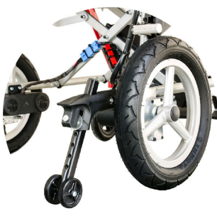
ล้อกันหยาบ