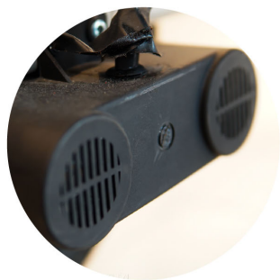
มอเตอร์ DC*200W 2ตัว