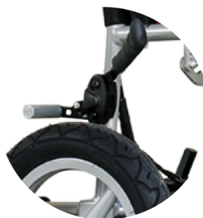
เบรกล้อล้อ

นำเข้าและจัดจำหน่ายโดย บริษัท เมดิคัลเทค จำกัด 89/7 โครงการ เจ.เอส.พี. เฟส 4 ถ.กัลปพฤกษ์ แขวงคลองบางพราน เขตบางบอน กรุงเทพฯ 10150