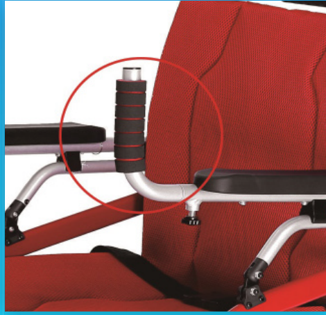
มีด้ามจับ